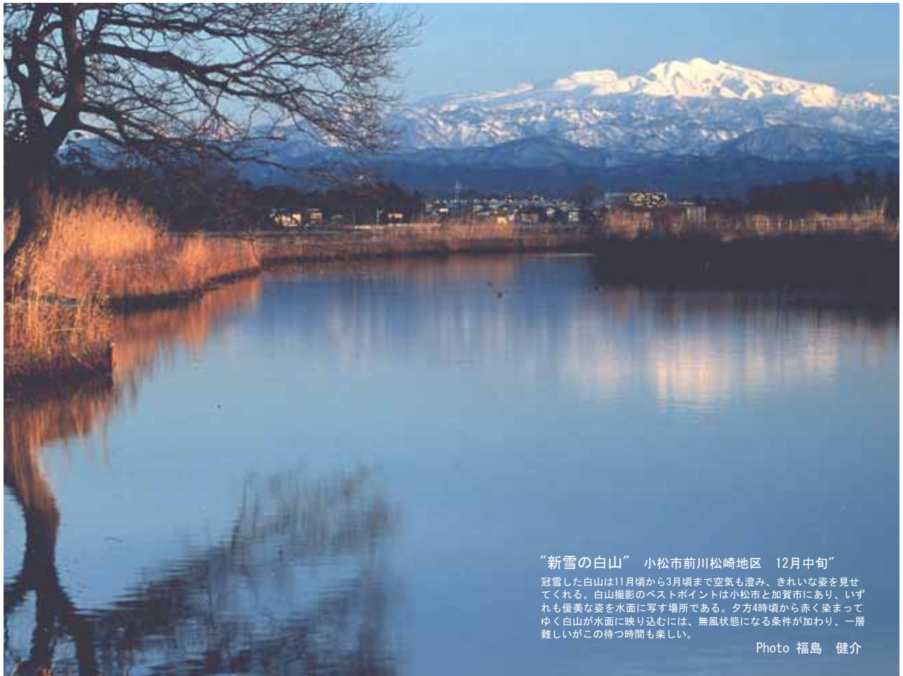
“新雪の白山” 小松市前川松崎地区 12月中旬”

冠雪した白山は11月頃から3月頃まで空気が澄み、きれいな姿を見せてくれる。白山撮影のベストポイントは小松市と加賀市にあり、いずれも優美な姿を水面に写す場所である。夕方4時頃から赤く染まってゆく白山が水面に映り込むには、無風状態になる条件が加わり、一層難しいがこの待つ時間も楽しい。