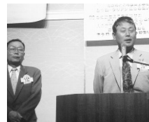
ゲスト 能美RC 浅倉会長