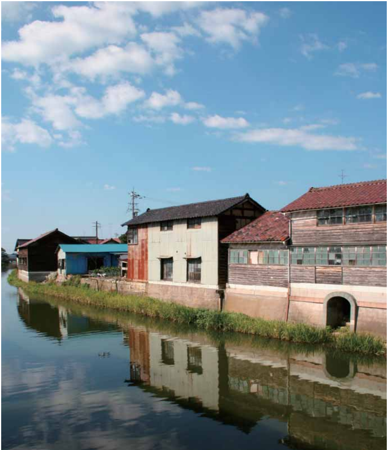
小松点景「今江・前川水景」