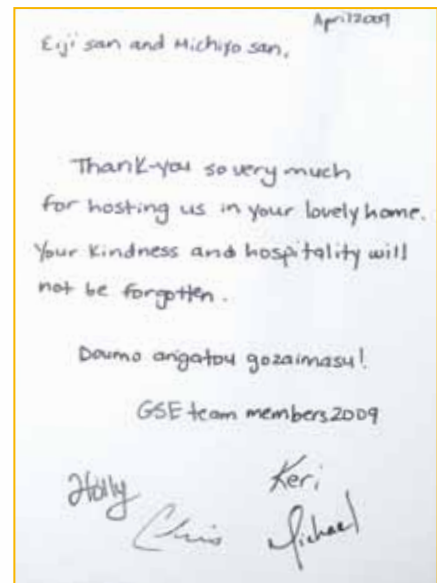
▲ GSEカナダチームよりメッセージ