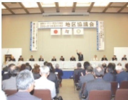
5月17日(日) 於：石川県地場産業振興センター 地区協議会に小松RC会員17名が出席