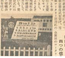
認証式と観光遊覧 小松

この認証式は、ロータリークラブの活動を通じて、社会の発展と人々の幸福に貢献することを目的として、一九一九年に創立された。その活動の中心は、慈善事業、教育事業、職業訓練事業、青少年指導事業、社会福祉事業、国際親善事業、文化交流事業、観光事業、スポーツ事業、その他多岐にわたる。その活動の成果は、社会の発展と人々の幸福に大きく貢献した。