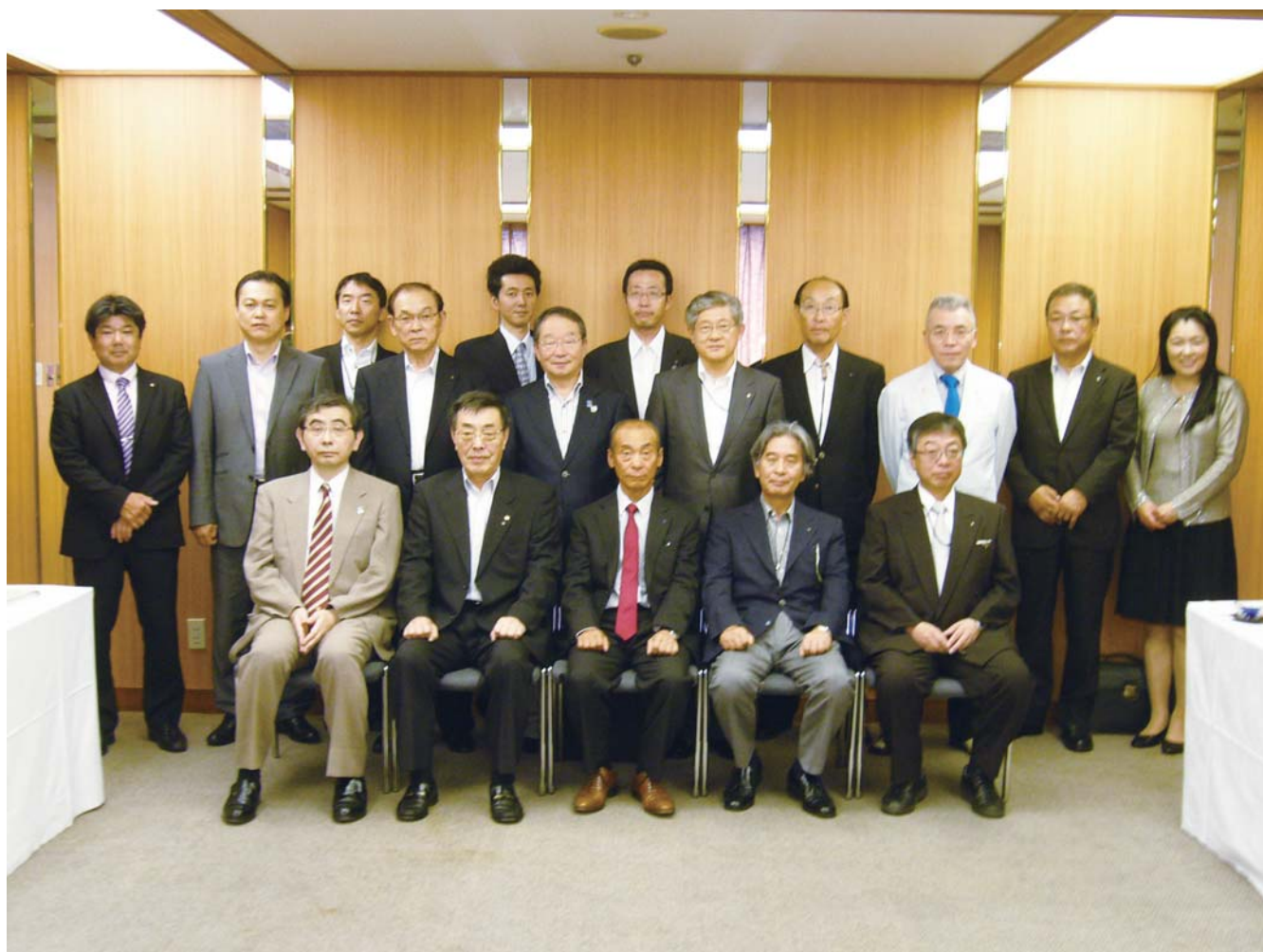
2013～2014年度 理事会メンバー

ロータリーを实践し みんなに豊かな人生を Engage Rotary Change Lives