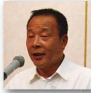
生水 敏雄 ロータリー財団委員長