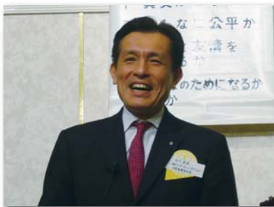
(株)イーピーエム・コーポレーション 代表取締役社長