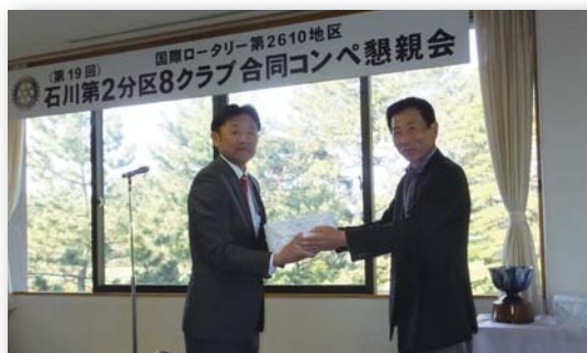
小松ロータリークラブ 団体戦3位入賞