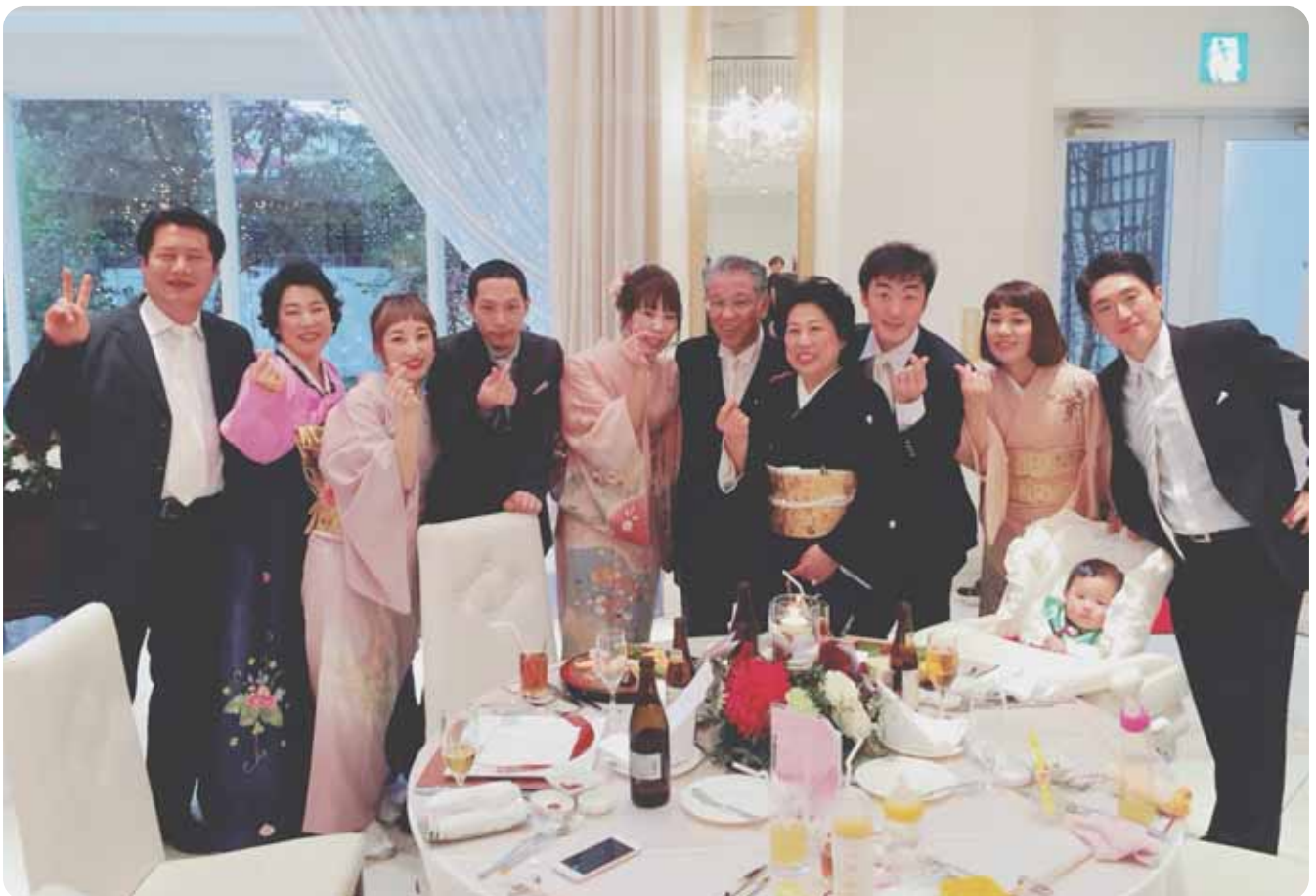
(左より 義兄1・姉1・義妹・弟・妹・父・母・義弟・姉2・姪・義兄2)