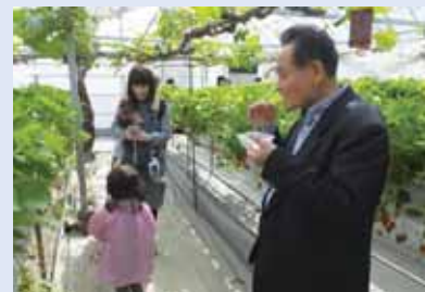
～ 蒲郡オレンジパークにてイチゴ狩り ～