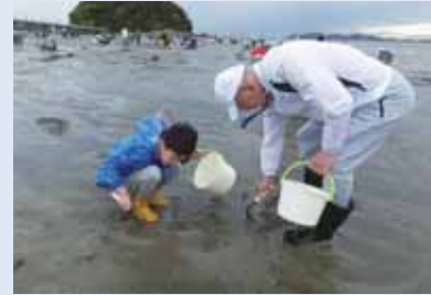
～ 竹島海岸にて潮干狩り ～