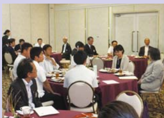
助成金贈呈 小松工業高校IAC・小松商業高校IAC