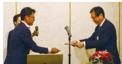
数左 従光 会員