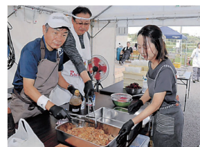
豚のしょうが焼きを調理する会員 = 志賀町富来防災センター

富来で炊き出し 小松RAC 小松ロータークラブ RACは20日、避難所とな っている志賀町富来防災セ ンターで炊き出しを行い、 被災者に豚肉のしょうが焼 きやマカロニサラダ、オク ラのスープを振る舞った。 会員6人が100食分を 調理した。ボランティア団 体「チームこのへん」と富 来RACが協力した。